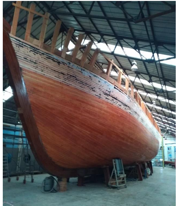
De voltooide eerste laag van de beplanking. De reling wordt in een andere houtsoort uitgevoerd

De VZW hoopt uiteraard dat er snel duidelijkheid komt over de toekomst van de Belgica en dat het werk op onze werf kan hervat worden, vooraleer de afwerking van het schip, die wellicht zal plaatshebben op een externe scheepswerf, wordt ingezet.